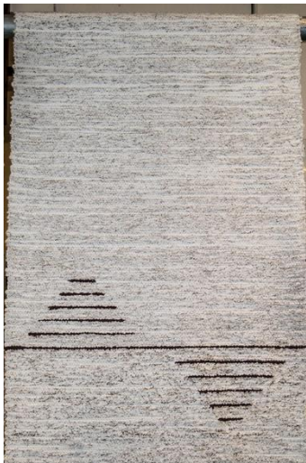
Nro 1 Pituus: 260 cm