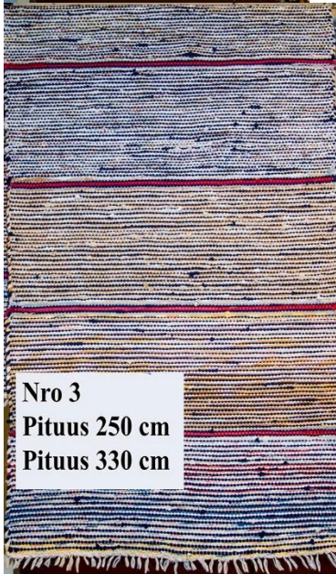
Nro 3 Pituus 250 cm Pituus 330 cm